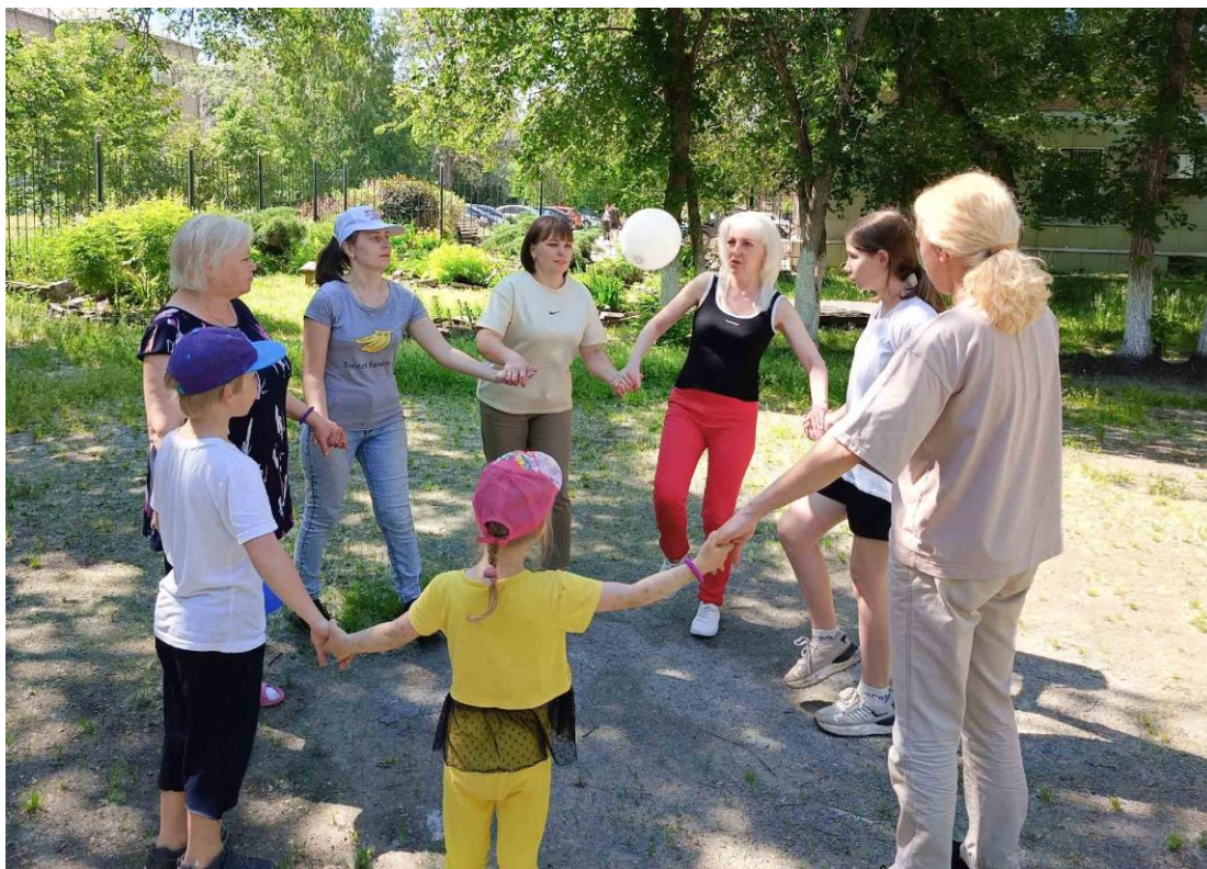
Игра «Круговорот шарика»

* Можно добавить правило, что подкидывать шарик можно только одной частью тела (например, только головой).