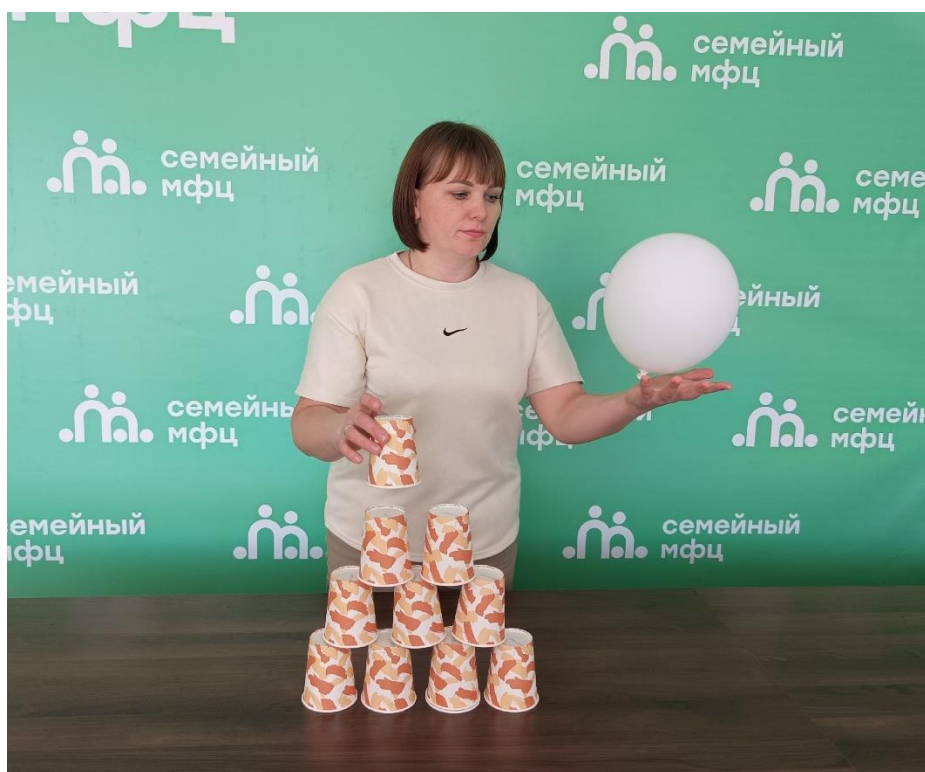
Игра «Воздушный фокусник»