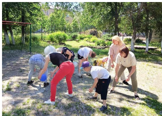
Передача «под ногами»