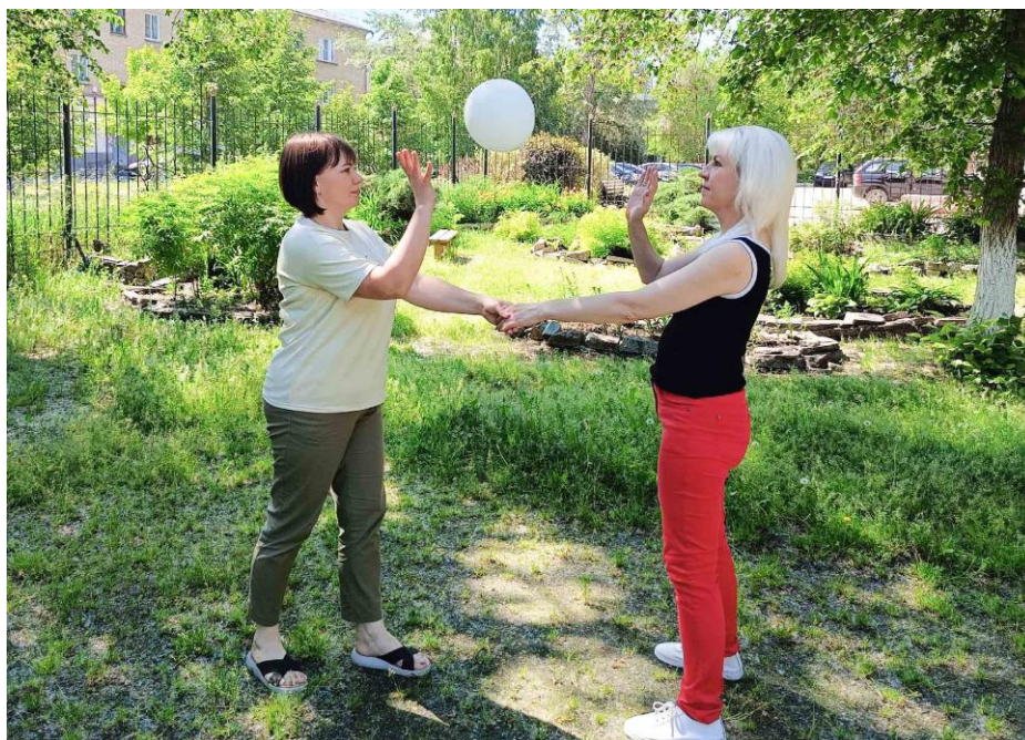
Игра «Воздушная пара»