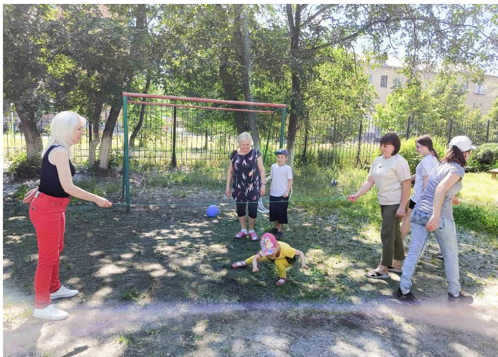
Игра «Пройди под скакалкой»