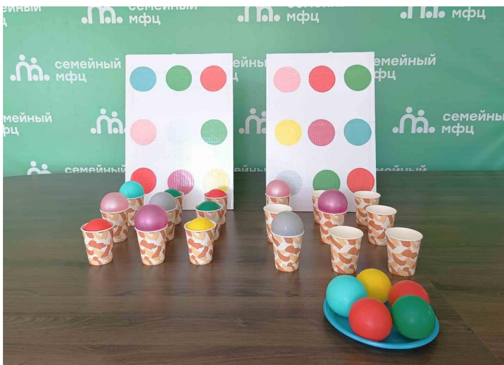
Игра «Радужный код»