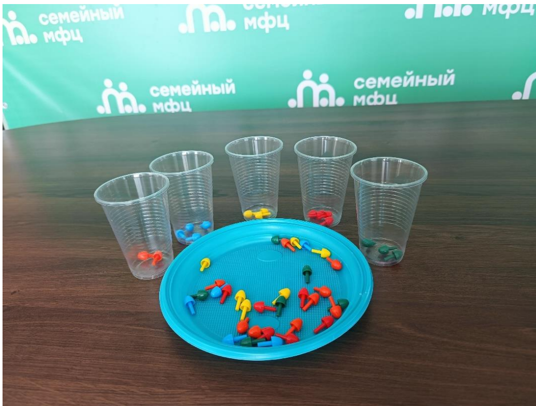
Игра «Цветной пасьянс»