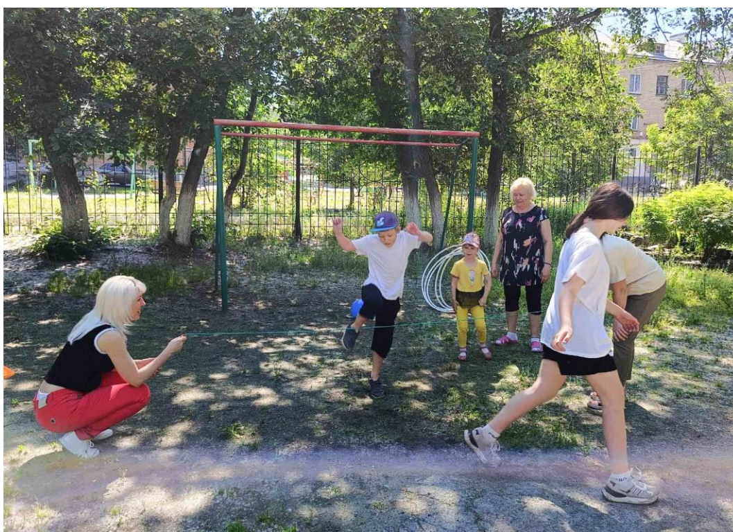
Игра «Перепрыгни скакалку»