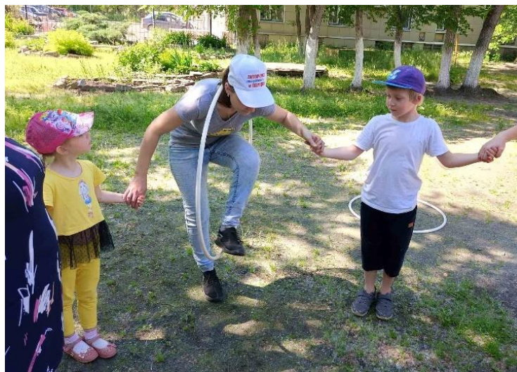
Игра «Обруч - цепочка»