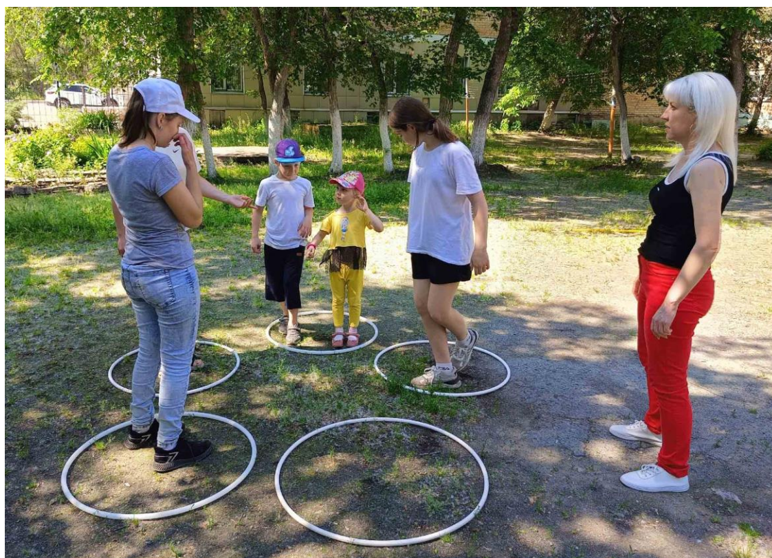
Игра «Веселый обруч»